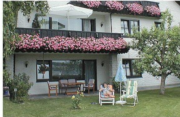
Blick vom Garten auf die Fewo-Terrasse

Abgeschlossene 60qm Wohnung bis 4 Personen, mit separatem Eingang, im EG