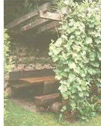
Pergola mit Weinlaube und gemauertem Grill

"Birne"-Gästen bieten wir den oberen Garten mit dem urigen, gemütlichen Gartenhaus an zum Chillen, Lesen, Grillen, Feiern.