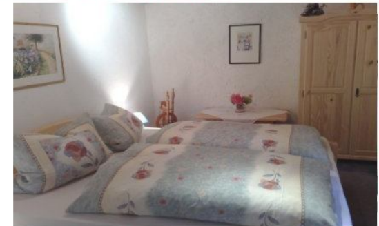
Schlafen mit Liegekomfort und Stil

Abgeschlossene, neu eingerichtete 55qm Fewo bis 3Pers. im OG mit Diele, Schlafzimmer, Du/WC und Wohnküche mit Schlafcoach/ Essecke, ideal für Kuschelurlaub zu zweit.