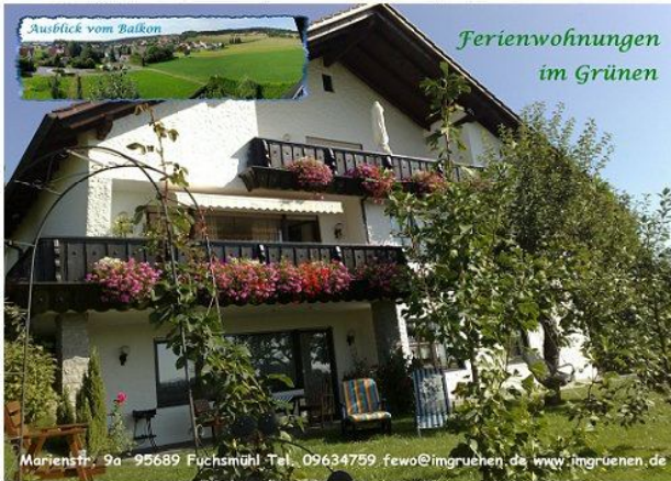
Ausblick vom Balkon Ferienwohnungen im Grünen

Unser gepflegtes Landhaus, Ihr Urlaubsquartier mit freier, schöner Aussicht und sehr kurzen Versorgungswegen vor Ort steht mitten im Grünen an einem saften Südwesthang 600 m ü. N.N. in ruhiger, zentraler Einzellage des Staatlich anerkannten Erholungsortes Fuchsmühl.